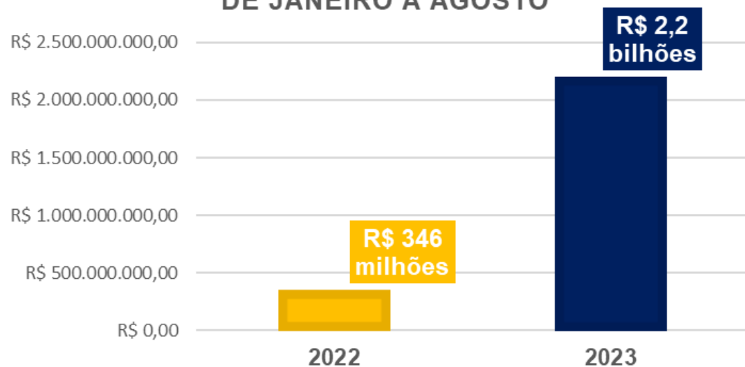
VALORES APREENDIDOS CGPRE/DICOR DE JANEIRO A AGOSTO